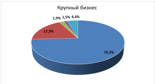
Диаграмма 2. Платежная дисциплина в разрезе размеров бизнеса в 2020 году. Доля компаний, в среднем оплачивающих счета в срок или с просрочкой